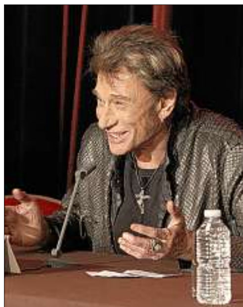
À presque 69 ans, le rockeur lance sa série de concerts qui passera le 18 décembre prochain par le Palais des sports de Grenoble. Rencontre.